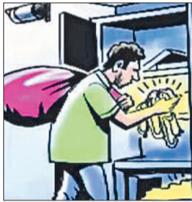
हरिभूमि न्यूज बहादुरगढ़

कश्मीरी कॉलोनी में स्थित एक बंद मकान को चोरों ने निशाना बना लिया। मकान की दीवार में संध लगाकर चोर नकदी व घरेलू सामान पर हाथ साफ कर गए। शिकायत के आधार पर पुलिस ने केस दर्ज कर जांच शुरू कर दी है।