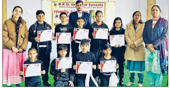
इज्जर। शिक्षकों के साथ नुकड़ नाटक प्रतियोगिता के विजेता विद्यार्थी।