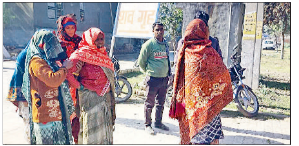
इज्जर। नगरिक अस्पताल परिसर में पोस्टमार्टम के दौरान विलाप करते हुए परिजन।