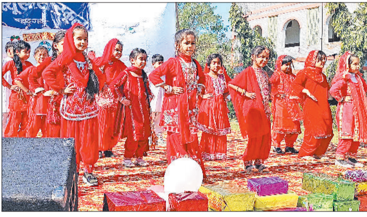
बहादुरगढ़। कार्यक्रम में प्रस्तुति देते माउंट व्यू स्कूल के विद्यार्थी।