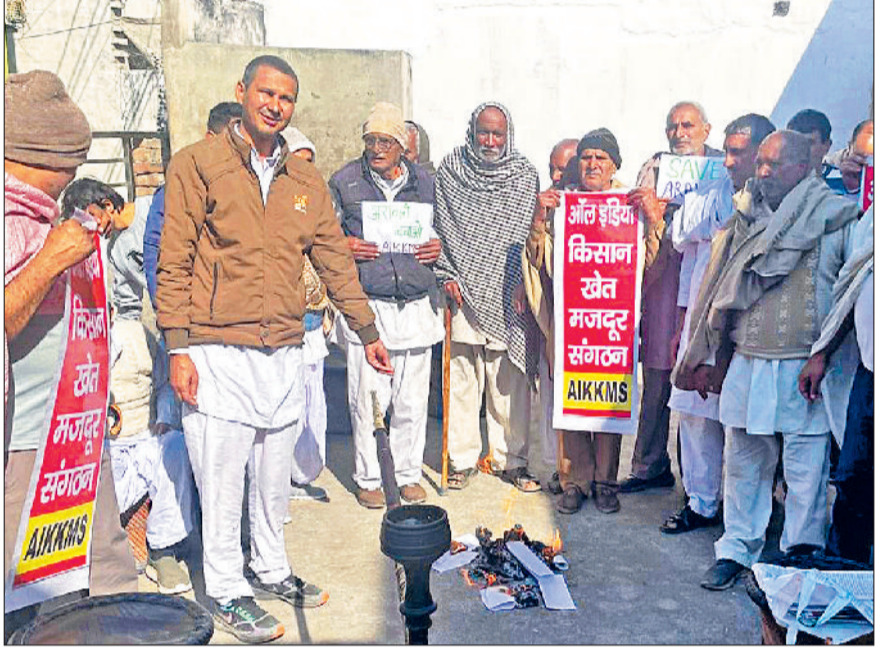
बहादुरगढ़। अरावली को लेकर हुए निर्णय की मांडोठी में प्रतियां जलाते ग्रामीण।