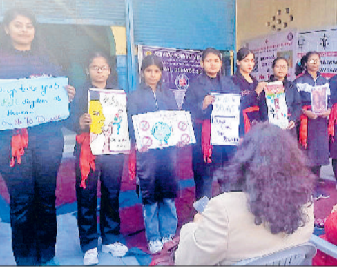
बहादुरगढ़। गांव सांखोल में नुकड़ नाटक प्रस्तुत करती स्वयंसेविकाएं।

वैश्य आर्य शिक्षण महिला महाविद्यालय की स्वयंसेविकाओं ने जिला विधिक सेवा प्राधिकरण के संयुक्त तत्वावधान में गांव सांखोल में नशे के विरुद्ध जागरूकता रैली निकाली और नुकड़ नाटक का आयोजन किया। गांव परनाला में भी नुकड़ नाटक के माध्यम से ग्रामीणों को नशे के दुष्प्रभावों के प्रति जागरूक किया गया। कार्यक्रम के उपरंत स्वयंसेविकाओं ने प्राचार्या डॉ.