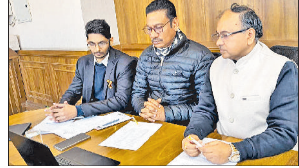
बहादुरगढ़। ऑनलाइन बैठक में विचार रखते कोवी पदाधिकारी।