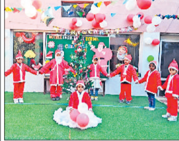
बहादुरगढ़। कार्यक्रम की प्रस्तुति देते नन्हे मुन्ने।

बहादुरगढ़। अशोक नगर में स्थित मदर इंडिया पब्लिक स्कूल में बुधवार को क्रिसमस-डे पर्व धूमधाम से मनाया गया। कक्षा नर्सरी से दूसरी तक के बच्चों ने बढ़-चढ़ कर भाग लेकर अपनी प्रतिभा का प्रदर्शन किया। बच्चे संता की पोशाक में आए और अलग अलग गानों पर प्रस्तुतियां दीं। अध्यापकों ने बच्चों को इस दिन का महत्व बताया और आगे बढ़ने की प्रेरणा दी। अंत में बच्चों को टॉफियां बांटकर कार्यक्रम का समापन किया गया।