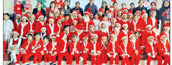
इज्जर। शिक्षकों के साथ उपस्थित सांता क्लॉज बने विद्यार्थी।