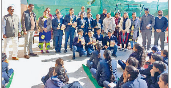
इज्जर। कार्यक्रम में उपस्थित होनहार विद्यार्थी एवं शिक्षक।