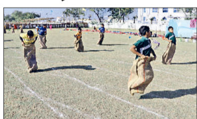
इज्जर। बोरी रेस में भाग लेते हुए खिलाड़ी।

संस्कारम् इंटरनेशनल स्कूल पाटौदा में चेरमेन ने ली परेड की सलामी