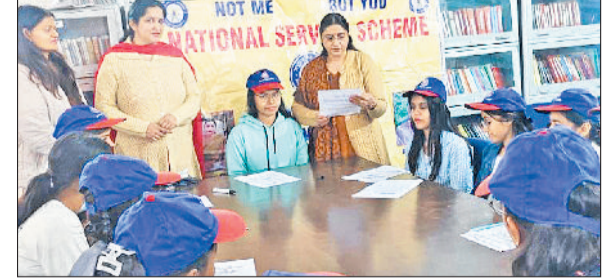
बहादुरगढ़। स्वयंसेविकाओं द्वारा बनाए पोस्टर-स्लोगन देखती प्रिंसिपल।