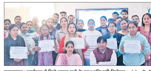
बहादुरगढ़। कार्यक्रम में मिले प्रमाण पत्रों के साथ प्रतिभागी विशेषज्ञ।