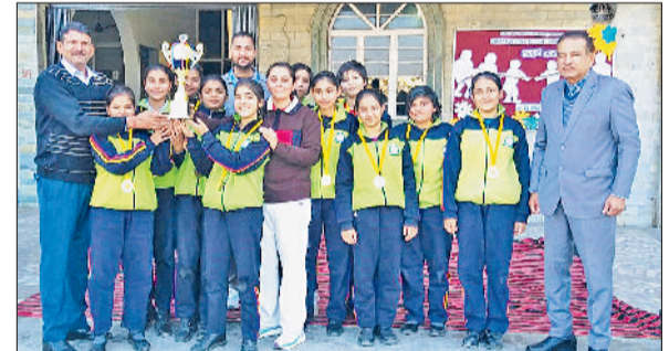
बहादुरगढ़। विजेता ट्रॉफी के साथ स्कूल की टीम।